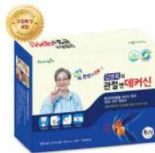
[ニュートラゼン] デカシン ケアジョイント 【HMXカナダ輸入】 オメガ-3100