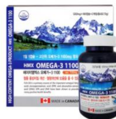
[HMXカナダからの輸入] オメガ-3100