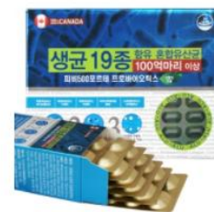
[PB500カナダ輸入] フォルテ プロバイオティクス