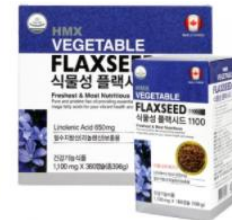
[HMXカナダの輸入] 植物性フラクシド110 0