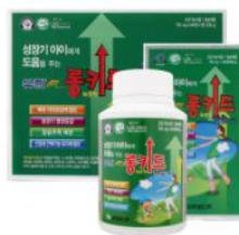
[有限メディカ] ロングキッドカルシウム (レモン味)