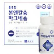
[チョングダン] ボンアンドカルシウム マグネシウム