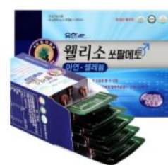
[有限メディカ] ウエルソフォルメト