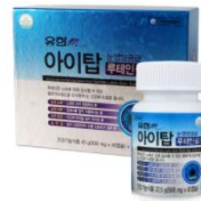
[有限メディカ] アイトップルテイン ゴールド